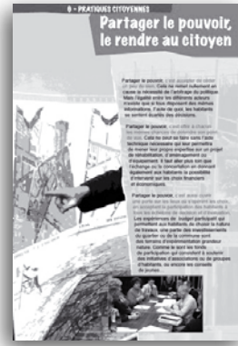
Panneaux d'exposition sur les démarches impliquant les habitants de Blanc Mesnil

de participation qui est très large dans cette ville. On a un conseil local des jeunes, élu au suffrage universel, un conseil local de la vie associative. Ce sont des instances thématiques, mais elles jouent un rôle, elles se réunissent, proposent, agissent. Ca fait quand même une offre de lieux d'échanges, de dialogue, de construction collective de projets, qui n'est pas négligeable. Pour autant, si on fait le total de tous ces espaces et du nombre de personnes qui viennent régulièrement ou qui donnent leur avis ponctuellement, on arrive à 2000, 2500 personnes, 10 % du corps électoral de la ville. Il ne faut pas s'en satisfaire. Et c'est la raison pour laquelle nous avons travaillé sur la Charte de la démocratie locale, pour donner encore plus de visibilité à tout ça. C'est le défi des mois et des années qui viennent, il faut vraiment qu'on arrive à ce que plus de gens encore s'investissent dans ces lieux, qu'on les démultiplie encore.