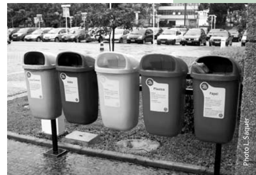
Tri sélectif sur un campus universitaire São Paulo, Brésil

Passerelle invite donc à ce qu'une réflexion soit menée pour tenter de minimiser l'empreinte écologique de notre Institut et plus largement de notre université. Le terme d'empreinte écologique étant d'ailleurs