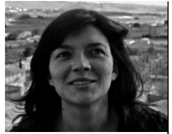
ATER à l'Institut d'Urbanisme de Paris