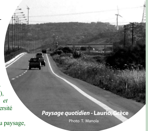
Paysage quotidien - Laurio, Grèce