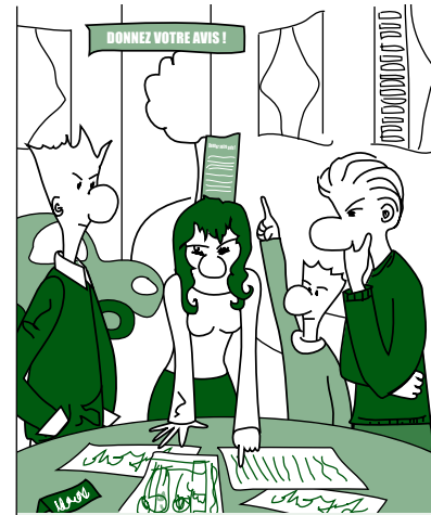
La place de l'habitant dans l'urbanisme