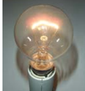
Lampe incan claire

La directive 2005/32/EC, dite EuP (Ecodesign requirements for Energy Using Products), est une directive cadre qui fixe les grands principes d'éco-conception des produits consommateurs d'énergie. Elle se décline en mesures d'application sectorielles, sous la forme de règlements.