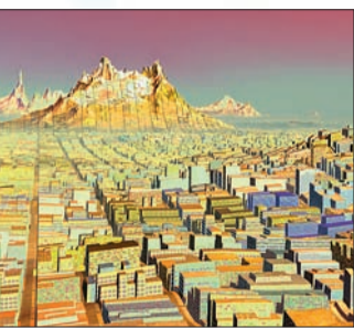
Villes imaginaires, ©Miguel Chevalier, artiste