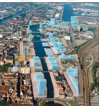
Réaménagement des vieux quais de Gand, Belgique, projet d'OMA sous la direction de Floris Alkemade, architecte-urbaniste