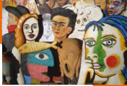
© Lionel Le Néouanic - Éditions du Panama